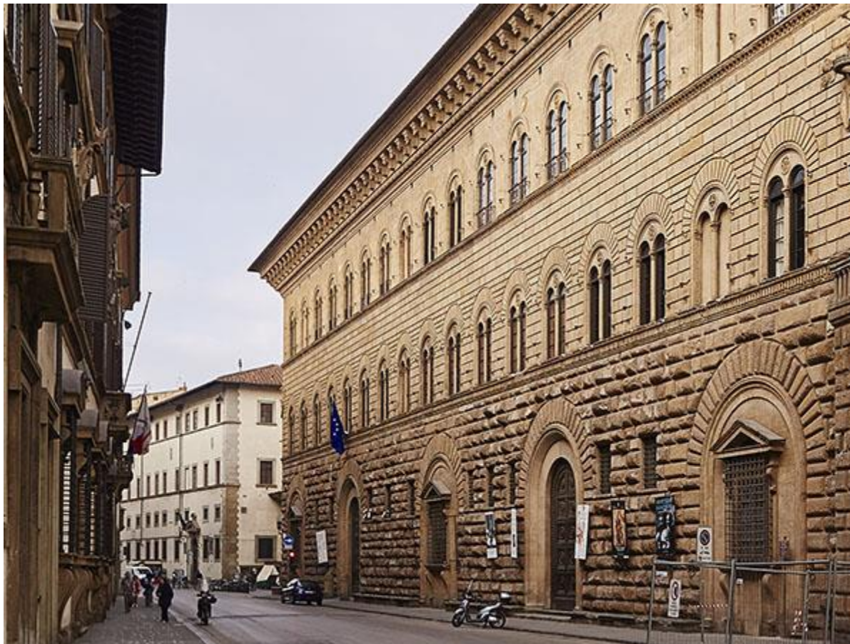
Palazzo Medici-Riccardi, Firenze (1444-59, Michelozzo)