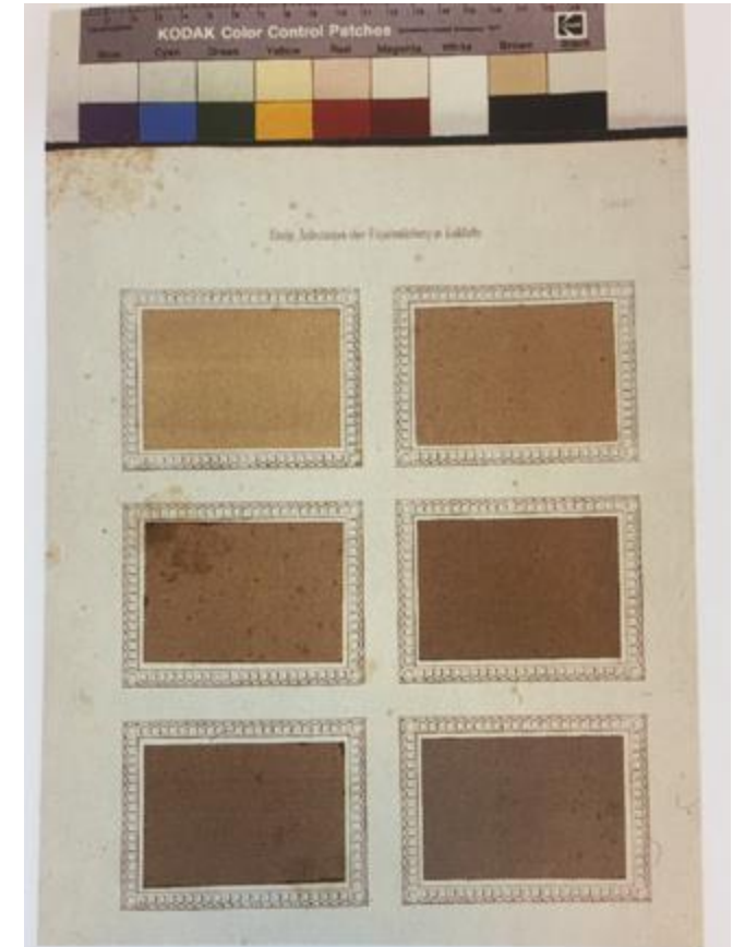
Fig. 4. Plansje fra artikkel om kalkmaling på fasader av Maler Hempel i Berlin, i Rombergs Zeitschrift für praktische Baukunst, 1853.