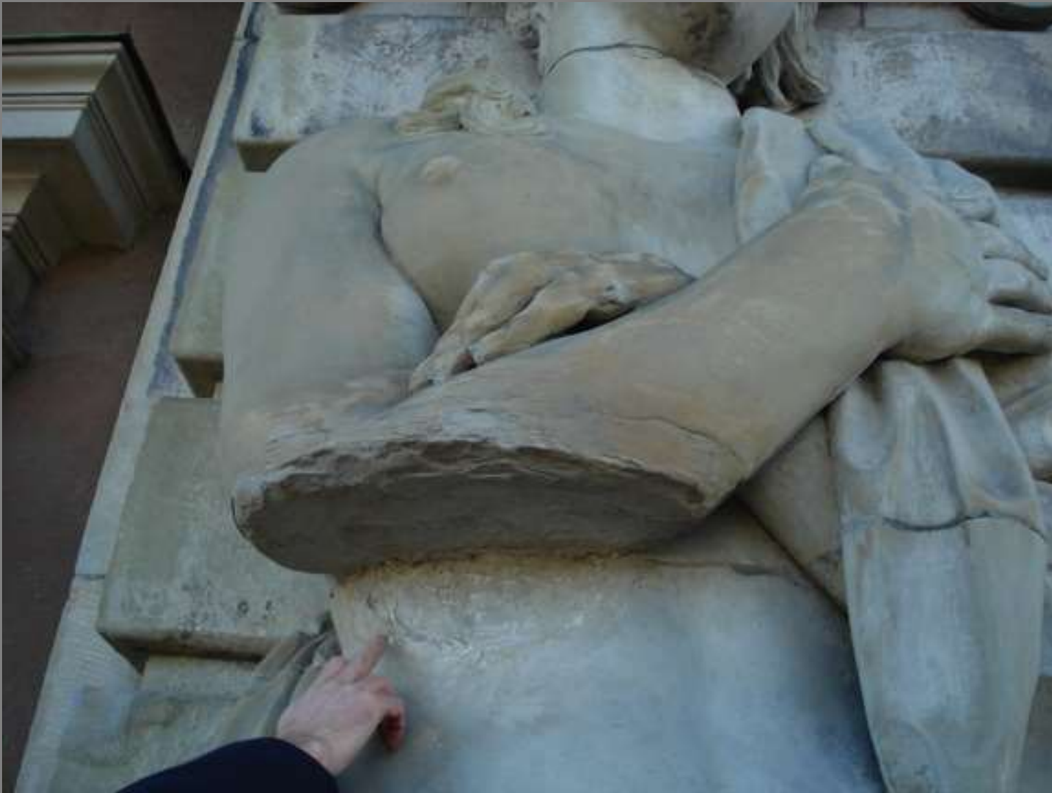
På håll ser slottet OK ut, men på nära håll framkommer skavankerna