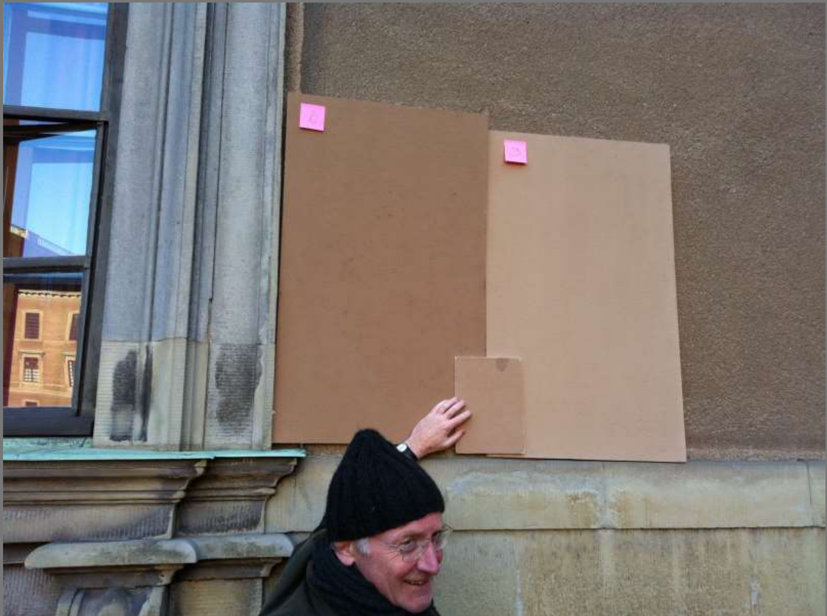
Jämförande test i skuggigt läge. Insnävat spektrum "sand".