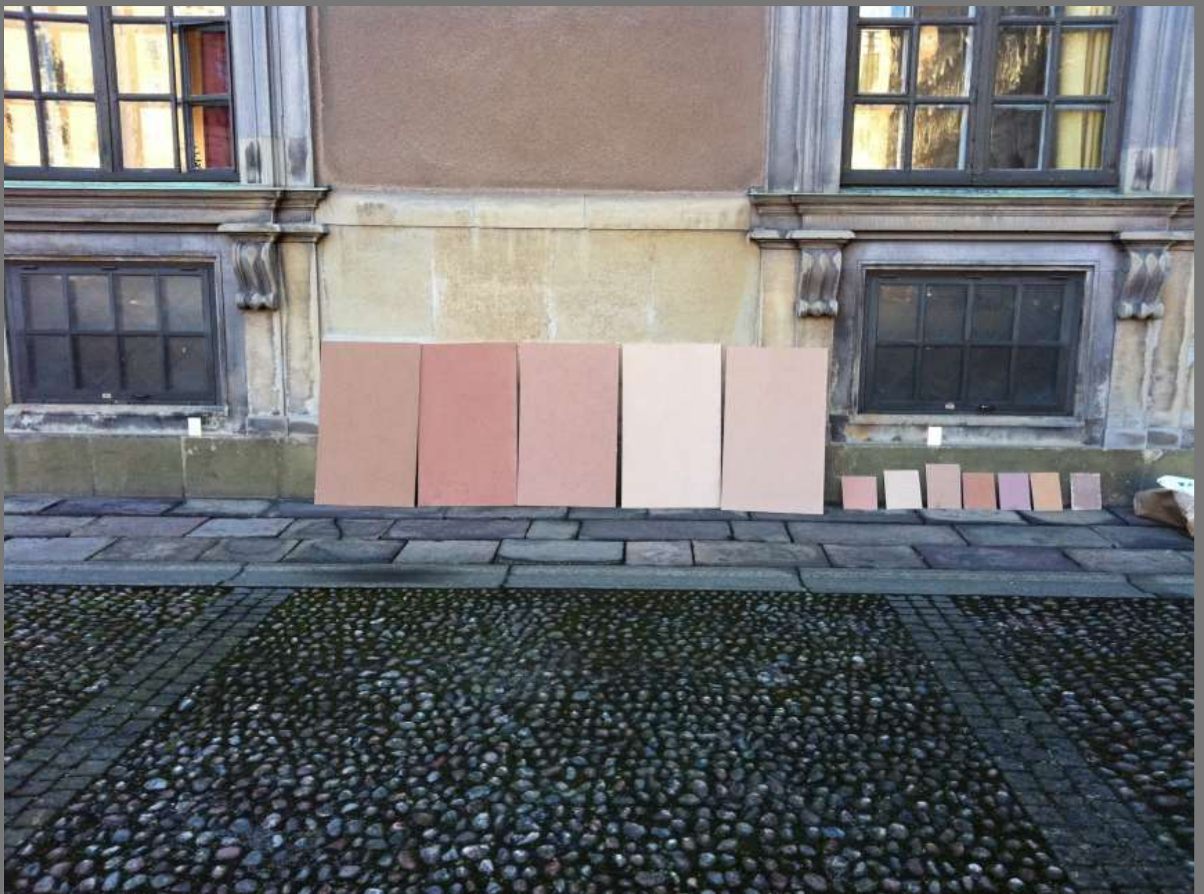
Stora målade prover redo för test på platsen