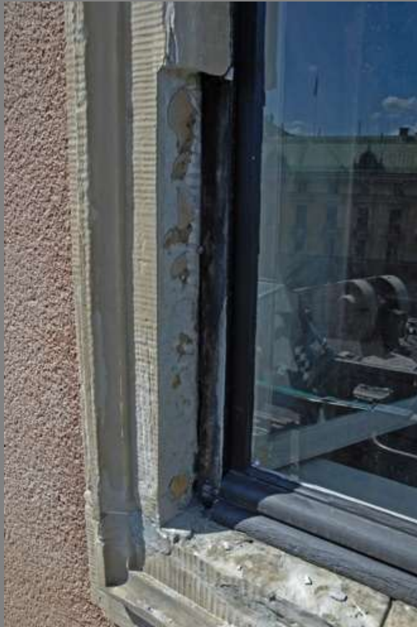
Resultatet av det sena 1900-talets tro på den kemiska industrin. Kompletteringssten var infäst med enbart limfog.