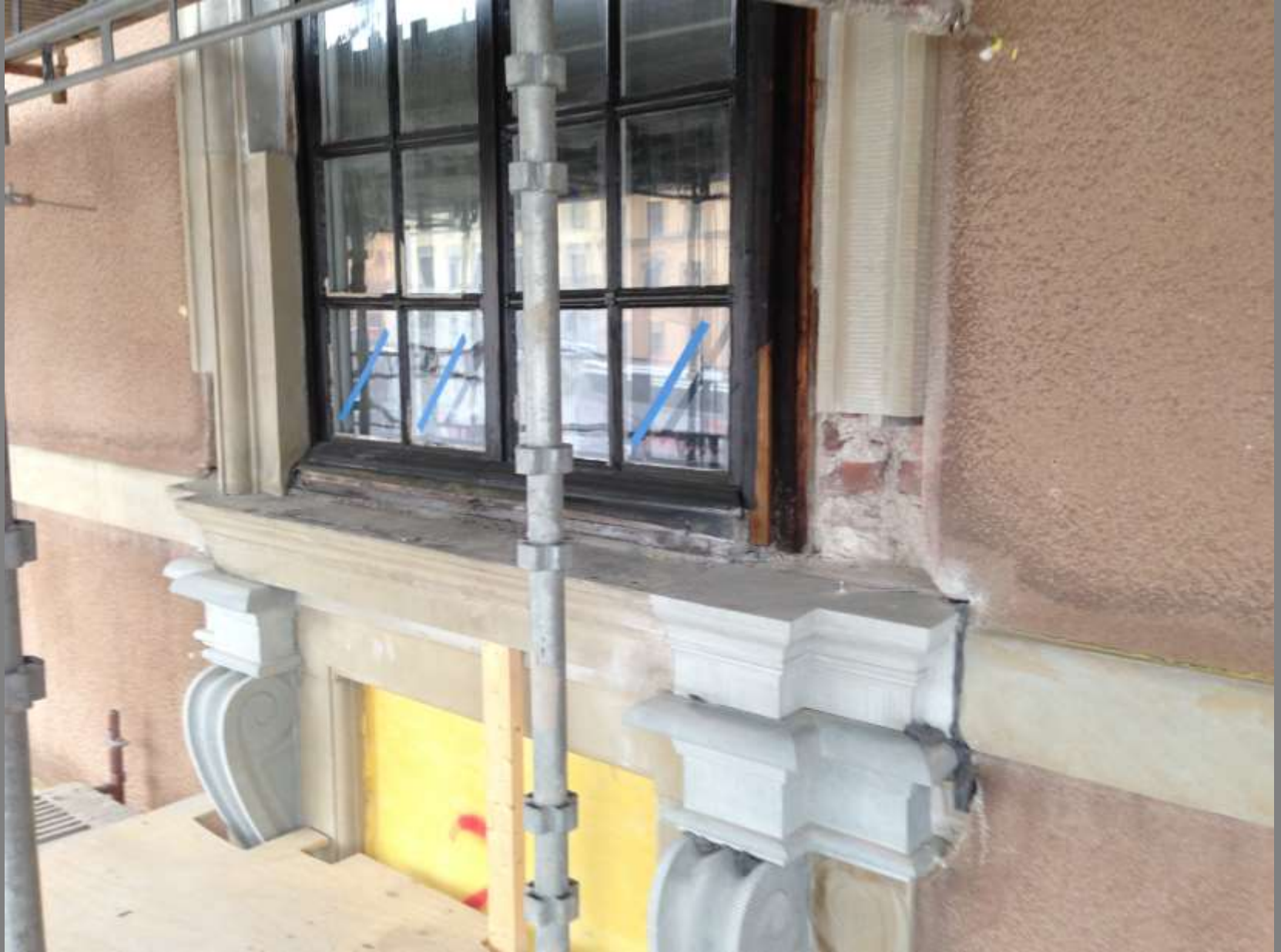
Stenbyten mot schweizisk Roschachersten i fönsteromfattningar